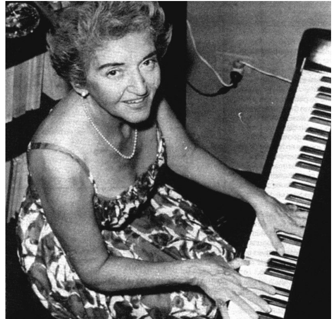
Conny Méndez: compositora y cantora

La tía Conny, ha estado en mi vida desde la adolescencia, primero a través del descubrimiento aparentemente casual de uno de sus libros en una tienda “Las Novedades” (reconocida cadena de librerías de la época) el título fue revelador para mí: Piensa lo bueno y se te dará , era un librito pequeño. Lo percibí como una fuente de poder, verlo despertó una fuerte curiosidad a mis tempranos 13 años. No era de un alto precio, pero no disponía del dinero suficiente para adquirirlo en ese momento. Tal fue mi interés que decidí volver después a esa tienda con lo suficiente para comprarlo. El dinero salió unos días más tarde, de lo ahorrado tomado de la asignación diaria que me hacía mi papá como merienda escolar. El día que lo compré, salí feliz de aquel lugar con el libro