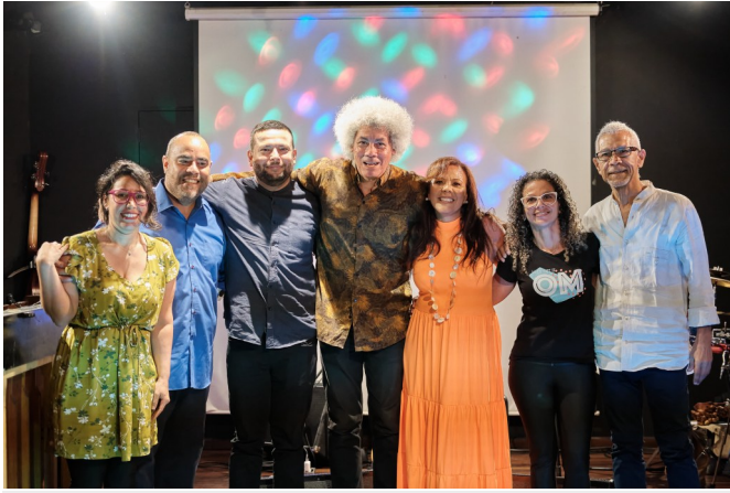
Elenco y equipo de producción. Relato musical Conjuros de una Loca, Tributo a Conny Méndez. Sala Cabrujas.

intérprete de un relato musical que titulé “ Conjuros de una Loca, Tributo a Conny Méndez ”. Dicho concierto formó parte integrante en el área performativa del trabajo de investigación referido, que me ha llevado a presentarlo en variados escenarios, que cuenta ya con dos ediciones y ser invitada para hablar en foros y conversatorios de la obra de Conny Méndez , todo lo cual me ha producido un gran crecimiento profesional y mucha felicidad.