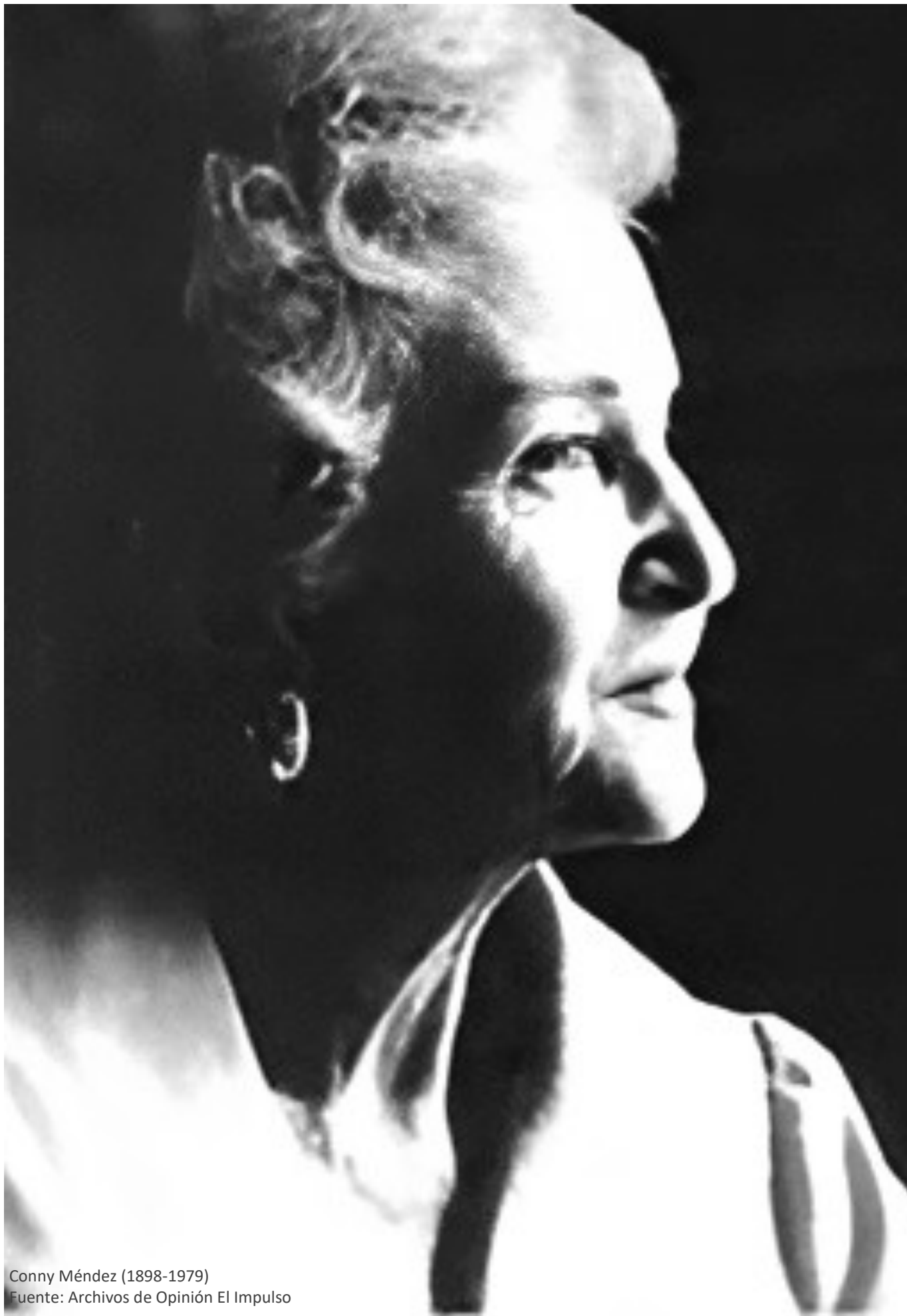
Conny Méndez (1898-1979)