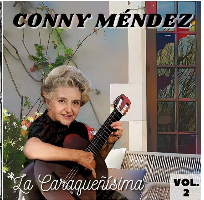
Legado discográfico de Conny Méndez: La Caraqueñísima, Volumen 1 y 2