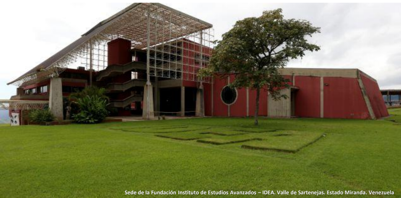
Sede de la Fundación Instituto de Estudios Avanzados – IDEA. Valle de Sartenejas. Estado Miranda. Venezuela

“El modelo de ciencia que nos domina y que hegemoniza el panorama mundial es un modelo de ciencia que por un lado se ha racializado a través de la construcción de la escala lineal del progreso y del desarrollo, donde el fin último de este progreso y lo más elaborado está encabezado por los blancos