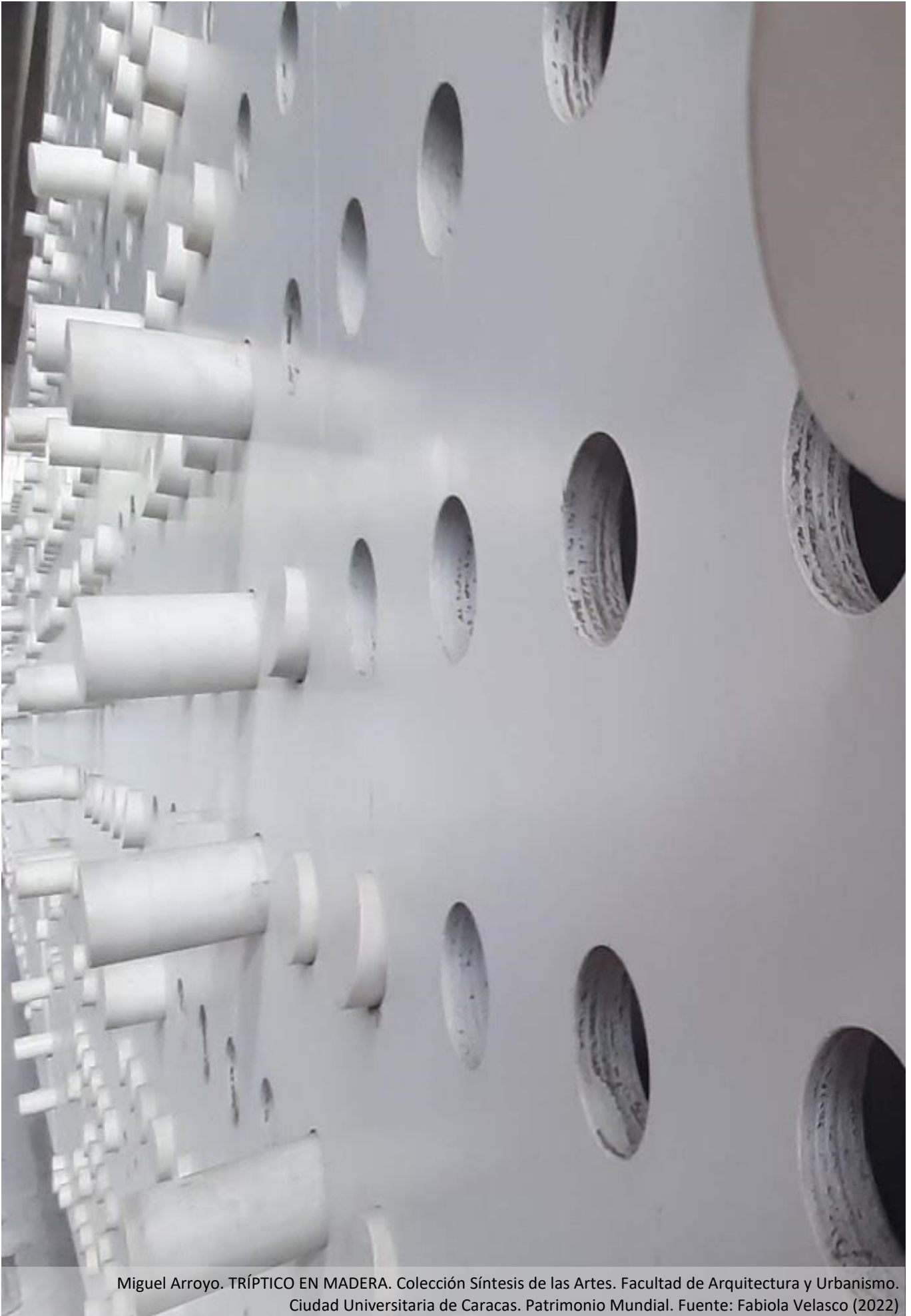
Miguel Arroyo. TRÍPTICO EN MADERA. Colección Síntesis de las Artes. Facultad de Arquitectura y Urbanismo. Ciudad Universitaria de Caracas. Patrimonio Mundial.