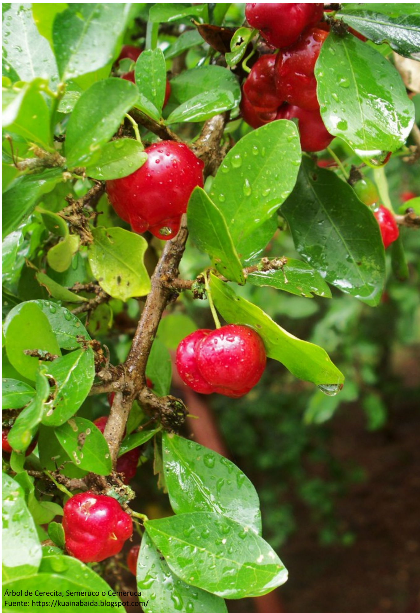
Árbol de Cerecita, Semeruco o Cemeruca.