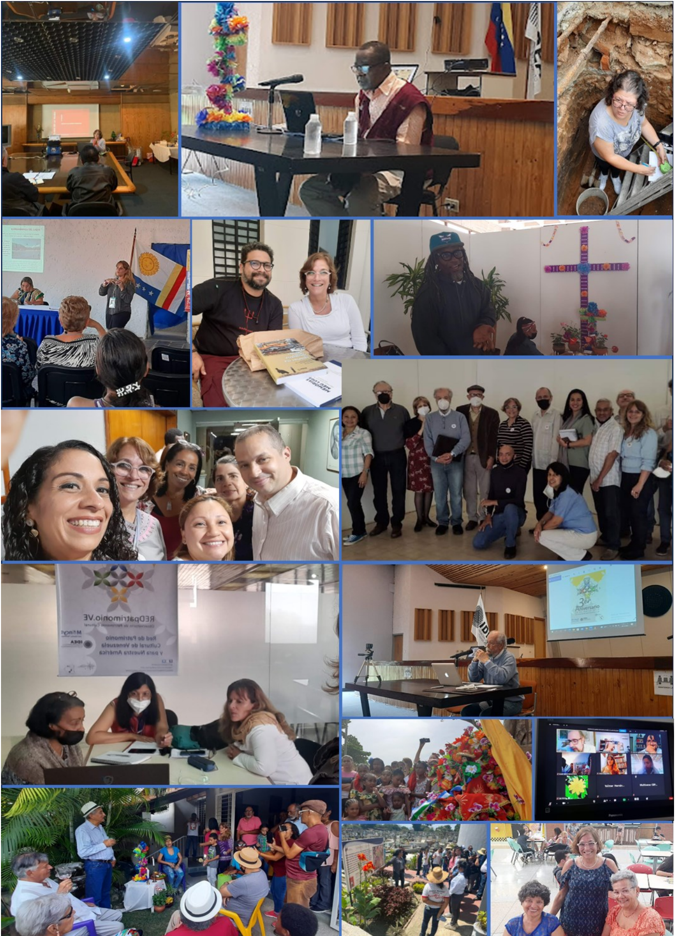
Miembros de la REDpatrimonio.VE